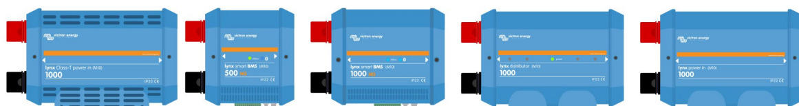
Produse Lynx Distribution cu bare de distribuție M10