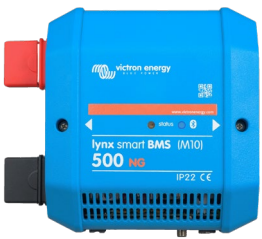
Lynx Smart BMS NG 500 A